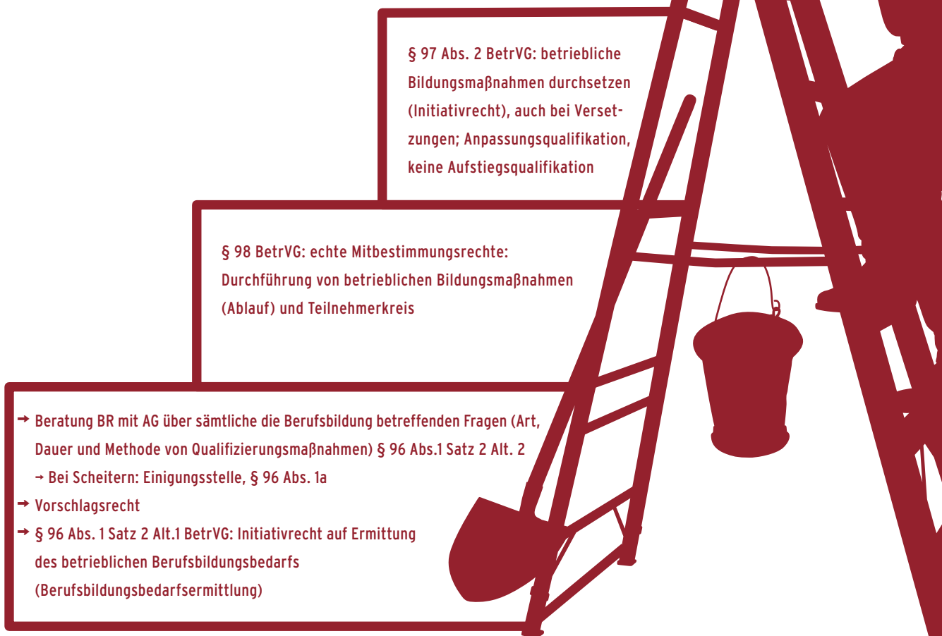
3-Stufen-Modell der Beteiligungsrechte des Betriebsrats bei Qualifizierungsmaßnahmen

Im Rahmen der Transformationsprozesse einer digitalen Arbeitswelt werden Qualifizierungsansprüche immer essentieller. Umso wichtiger ist es, dass Betriebsräte ihre Möglichkeiten kennen, gemeinsam mit dem Arbeitgeber und den Belegschaften diese Prozesse erfolgversprechend zu gestalten. Denn nicht nur die Arbeitgeber sind hier für die Weiterbildungsmaßnahmen zu begeistern, auch die Arbeitnehmer misstrauen oftmals einer Erfassung ihrer Leistung und ihrer Qualifikation. Daher können diese Herausforderungen nur im Miteinander und unter frühzeitiger Einbindung aller Beteiligten gemeistert werden.